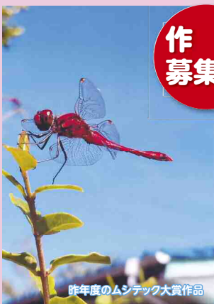
昨年度のムシテック大賞作品